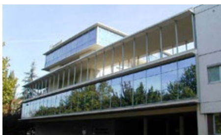
Fondation de la Maison du Diaconat de Mulhouse

Effectivement, dès septembre 2014, nous avons été interpellés, via la Fédération Protestante de France, la FEP au niveau national et l'UEPAL au niveau régional, pour, dans un premier temps, recenser des possibilités d'hébergements pour de futurs migrants venant de Syrie et de manière plus générale du Moyen Orient, persécutés dans leur pays. Nous étions à l'époque loin de la médiatisation de cet accueil que nous avons connue plus récemment. De la simple fonction de recensement nous sommes passés à une fonction de coordination voire d'accueil sur le quai de la gare et d'aide aux migrants. La FEP Grand Est, avec ses deux salariées, n'est bien-sûr pas équipée pour faire face elle-même à de telles missions mais avec le soutien de ses adhérents et de son réseau elle a pu relever ce défi qui n'était pas gagné d'avance. C'est ainsi, grâce à l'expertise de l'association l'Étage, du Centre Social Protestant, de la Cimade, d'une très bonne collaboration avec les services de l'UEPAL, d'un soutien récent de l'Action Chrétienne en Orient, de soutien de paroisses et de particuliers, et j'en oublie certainement, que ce travail a été possible et efficace. Suite à une diffusion d'un cliché d'un enfant mort, cette activité, restée longtemps presque confidentielle en France, est passée sous les feux des projecteurs, en faisant la une des médias, et plusieurs des acteurs que nous avions sollicités et qui ont ouvert leur maison, ont dû l'ouvrir également aux caméramen.