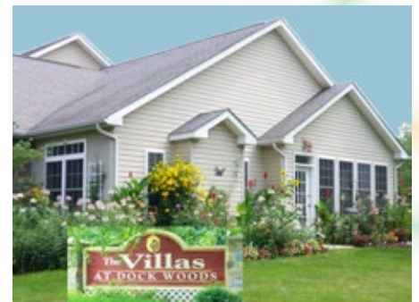
Une maison pour la retraite.

Source : Claude Hege, « Travail social aux USA » dans Christ seul , n° 1058, octobre 2015, p.12.